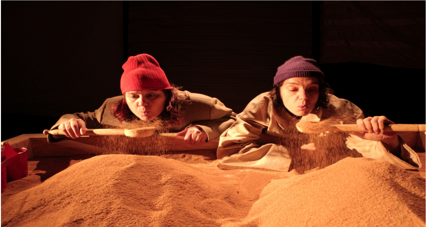
Le Carré de Sable